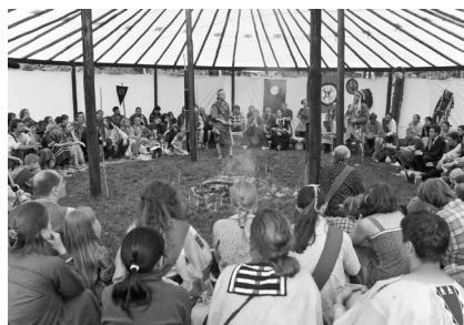
v kruhu kolem ohně

Sněm slouží k projednání důležitých věcí společenství, k udílení orlích per a titulů, ale i k zábavě; je vhodné do programu zařadit píseň nebo krátkou hru, zvláště, jsou-li přítomny děti.