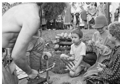
zapálení ohně třecími dřevy